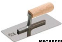
металлический шпатель (кельма)